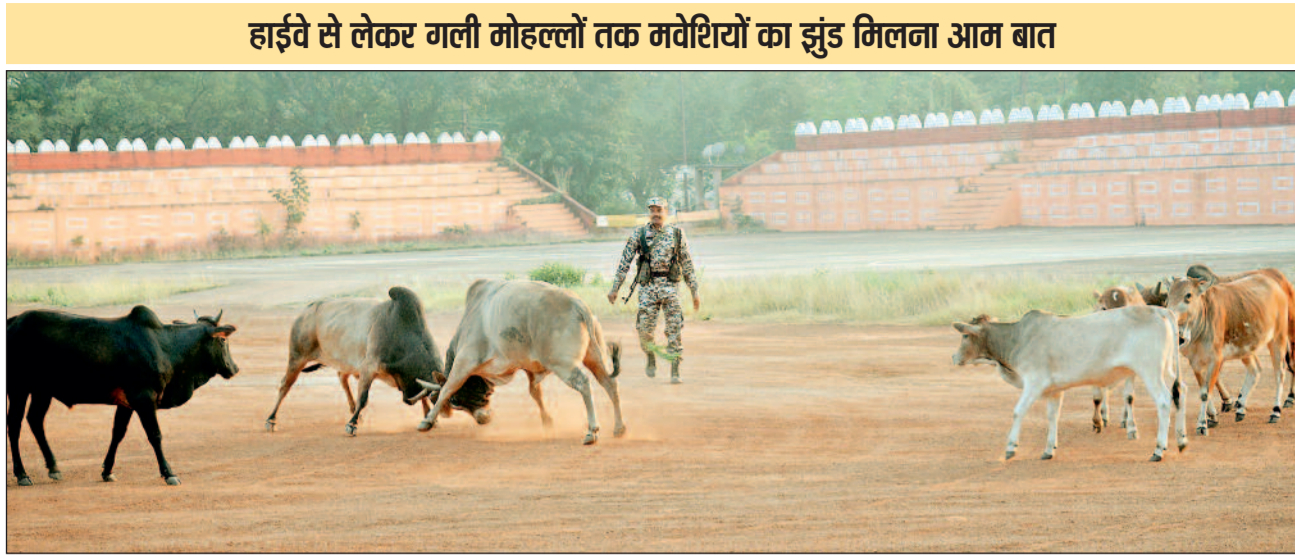
हाईवे से लेकर गली मोहल्लों तक मवेशियों का झुंड मिलना आम बात

हाईवे से लेकर गली मोहल्लों में जहां तहां मवेशियों का झुंड मिलना आम बात है। मवेशी अब उन संवेदनशील क्षेत्र जिनकी गणना सबसे सुरक्षित क्षेत्र के रूप में होती है, मवेशी वहां तक पहुंच कर अपनी धमक दिखा रहे हैं। ऐसा ही नजारा शुक्रवार को पुलिस लाइन स्थित हेलीपैड में देखने को मिला। पुलिस लाइन स्थित हेलीपैड में आधा दर्जन के करीब मवेशी अंदर जहां मुख्यमंत्री सहित अन्य मंत्रियों का हेलीकॉप्टर लैंड होता है, उस जगह पर झुंड में दिखे। जहां मवेशी एकत्रित हुए थे, उसी जगह दो सांड आपस में फाइटिंग करते दिखे। मौके पर उपस्थित सुरक्षा के जवान मवेशियों को हकाल कर बाहर निकालने की कोशिश करते दिखे। मवेशी भी इतने डीठ की सुरक्षा बल के जवान हकाल कर बाहर निकालने की कोशिश कर रहा, लेकिन मवेशी अपनी जगह पर डटे दिखे। आपस में फाइट कर रहे मवेशियों को सुरक्षा जवान के हकालाने का किसी भी प्रकार से असर होता नहीं दिख रहा।